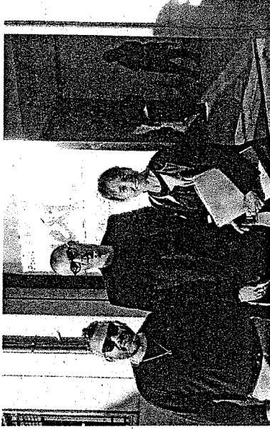
Il nuovo negozio verso l'apertura