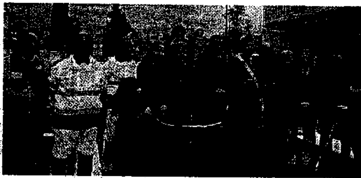
L'inaugurazione di ieri, dopo i lavori di riqualificazione