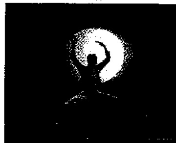
Nicola Galli sul palco

Oggi alle 17 al via la rassegna E' Bal al Teatro Comunale. Oggi in scena Nicola Galli con Mars • kids. Al termine dello spettacolo seguirà un incontro con l'artista per dialogare con il giovane pubblico sui codici e sul linguaggio della danza contemporanea. Lo spettacolo è adatto ad adulti e bambini a partire dai 6 anni.