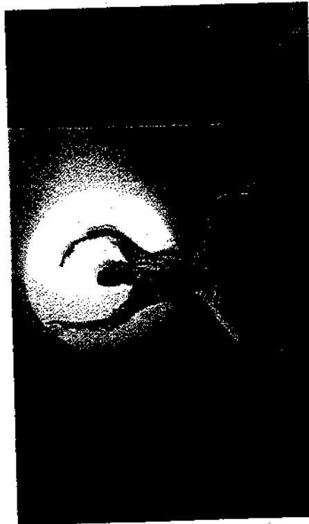
"Mars-kids" di Nicola Galli

frutto di una residenza collaborativa fra Petrella e teatro Dimora di Mondaino. A Gambettola propone Mars, concept coreografico "esplorativo" di un paesaggio immaginario del pianeta Marte. Un corpo si svela sulla superficie aliena del pianeta, è illuminato da lu-