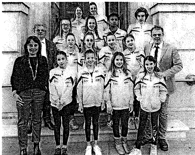
La Nuova Olimpia in municipio