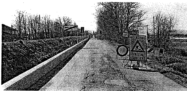
Lavori in corso lungo il Rigossa

Un progetto ciclopedonale sul torrente Rigossa da Cesenatico a Longiano alta, attraverso Gatteo e Gambettola. Un filo rosso che porterebbe cicloturisti e famiglie dalla costa a uno dei borghi più panoramici della Romagna, attraversando i territori del castello di Gatteo e della casa di Fellini.