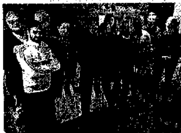
L'incontro in Regione

I funzionari della Cna e della Confartigianato hanno avanzato proposte operative che siano in grado di supportare gli artigiani del settore, a partire dal coinvolgimento dei responsabili dell'Ufficio Turismo della Regione Emilia Romagna, che possono fin da subito promuovere il cir-