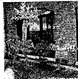
Sopra la fiera ieri pomeriggio