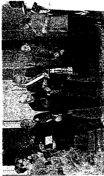
Il taglio del nastro per inaugurare la nuova struttura

circa 3 mila anziani, 700 persone con disabilità, 1.800 minori e 1.000 adulti. Abbiamo chiuso lo scorso anno con un fatturato tra i 23 e i 24 milioni di euro».