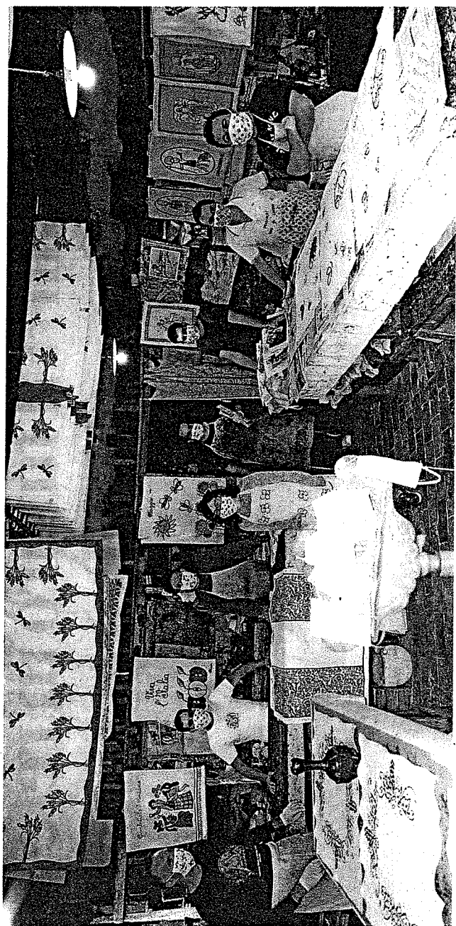
Al lavoro nella Bottega Pascucci per creare mascherine con un tocco artistico-artigianale