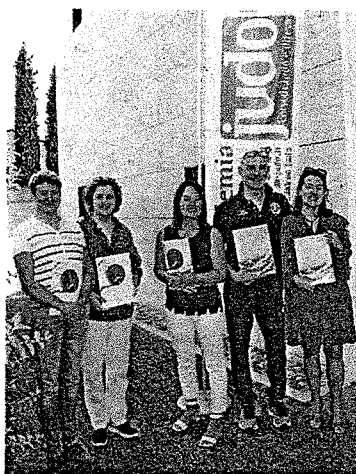
La presentazione del progetto per portare nelle scuole gambettolesi la "cultura" del judo

«Il progetto si pone l'obiettivo di promuovere e potenziare l'attività sportiva nei giovani, attraverso la pratica dello judo - ha il-