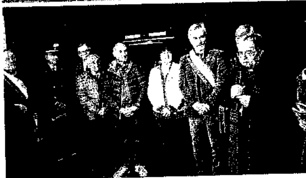
Le tre inaugurazioni del presepi: qui sopra, quello di Gambettola; in alto, quello a Roncofreddo; in mezzo, la "Longiano del presepi"